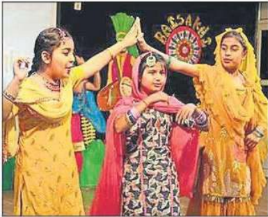
Gurukul students on Baisakhi.