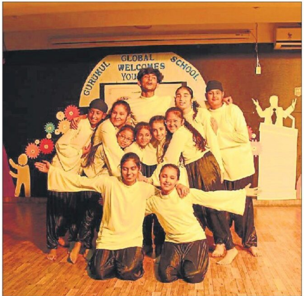
Gurukul Global School students showcasing dancing skills during the Model United Nations event.

It was followed by an award ceremony that celebrated the efforts of participants. Gurukul Global School principal said the event concluded on a high note, leaving behind a trail of memories that will forever resonate in the hearts of all who attended. She also encouraged more students to participate in the activities that enhance their speaking and intellectual abilities.