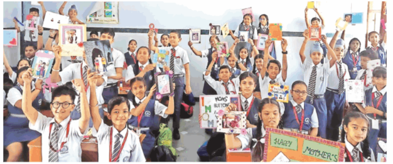
बच्चे मां के लिए कार्ड बनाते हुए।