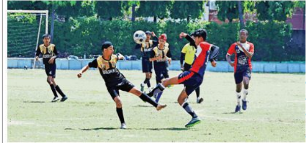
मैच खेलती सेंट जॉस और सेंट सोलजर इंटरनेशनल स्कूल की टीम