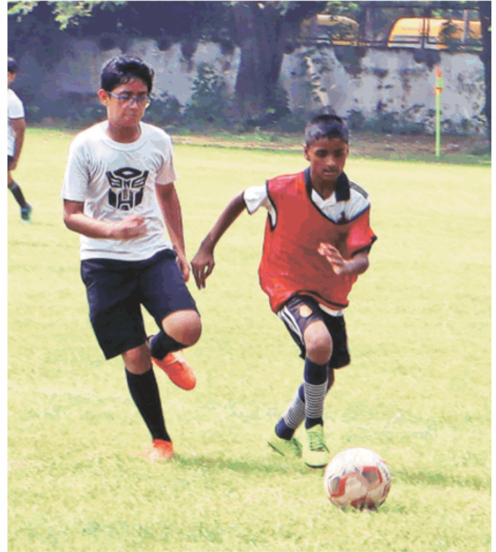
फुटबॉल मैच के दौरान गोल करने की कोशिश करते खिलाड़ी। (परमजीत)