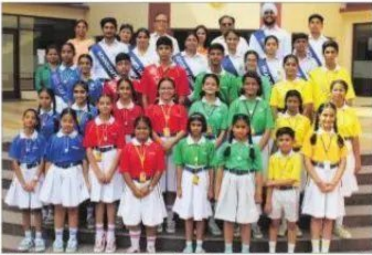
Members of the Gurukul Global School student's council.