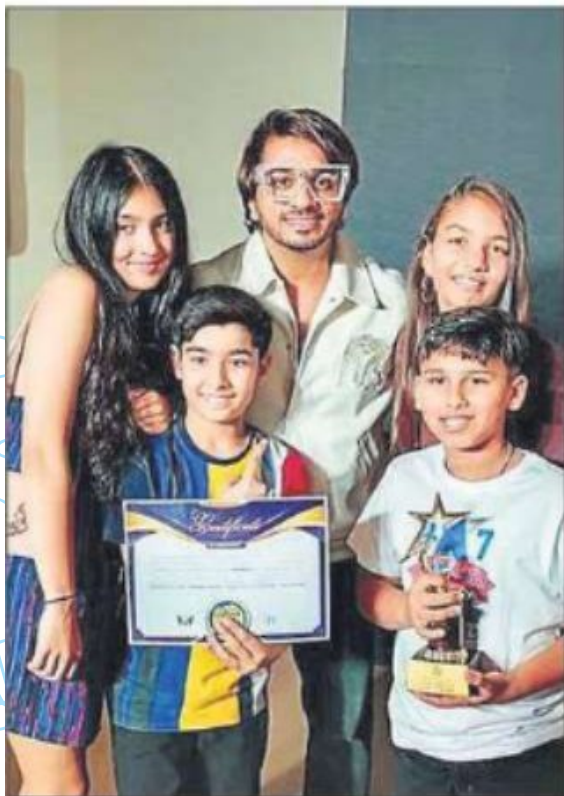
Jubilant participants with their certificates and trophy.