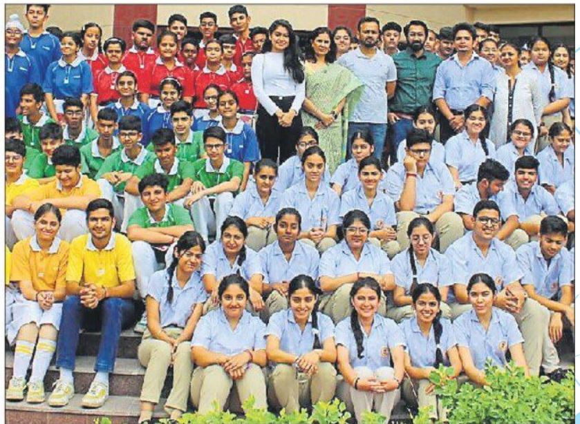
Students and alumni association members of Gurukul Global School during alumni meet.