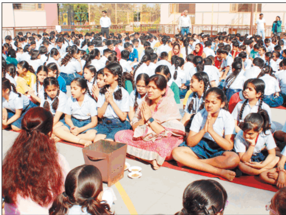
स्कूल में बच्चे हवन में हिस्सा लेते हुए।