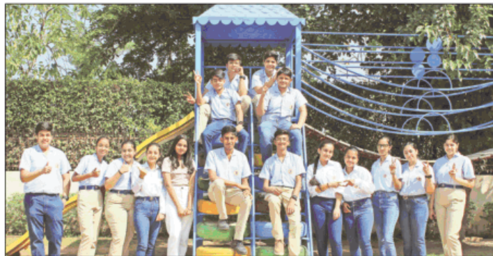
स्कूल के मेधावी बच्चे।

उन्होंने एक प्रस्तुति भी साझा की जिसमें छात्रों की उपलब्धियों पर प्रकाश डाला गया और सभी टॉपर्स