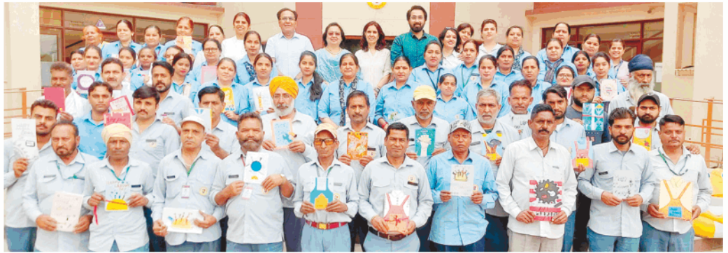
सैक्टर-13 स्थित गुरुकुल ग्लोबल स्कूल में बच्चों द्वारा हैल्पर्स को दिए गए थैंक्यू कार्ड।