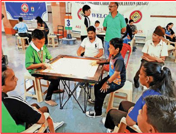
पांचवीं इंटर स्कूल कैरम चैंपियनशिप में खेलते प्रतिभागी खिलाड़ी

इसके अलावा माउंट कार्मल मोहाली ने डीएवी-39 को 2-1 से, सेंट स्टीफंस-45 ने कुंदन इंटरनेशनल-46 को 3-0 से, गुरुकुल ग्लोबल मनीमाजरा ने टेंडर हार्ट को 3-0 से, लारेंस पब्लिक सीनियर सेकेंडरी स्कूल मोहाली ने टेंडर हार्ट को 2-1 से,