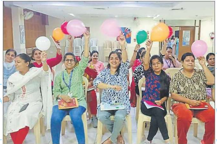
Attendees during the workshop in Gurukul Global School.