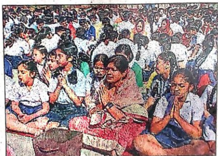
Gurukul students during the havan.