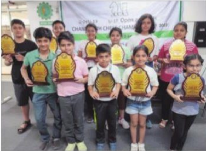
Winners of the Chandigarh Chess Championship.