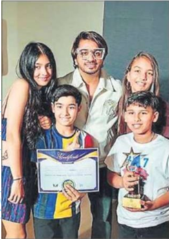
Jubilant participants with their certificates and trophy.