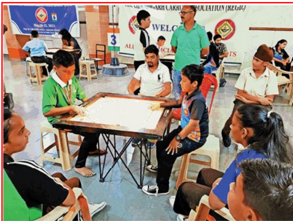
पांचवीं इंटर स्कूल कैरम चैंपियनशिप में खेलते प्रतिभागी खिलाड़ी •स्वतः

जागरण संवाददाता, चंडीगढ़ : सेक्टर-45 स्थित सेंट स्टीफंस स्कूल में आयोजित पांचवीं इंटर स्कूल कैरम चैंपियनशिप में लड़कों के मुकाबले में टेंडर हार्ट-33 ने जीएमएसएसएस-16 को 2-1 से हरा दिया। प्रतियोगिता के अन्य मुकाबलों में माउंट कार्मल मोहाली ने कुंदन इंटरनेशनल-46 को 2-1 से, गुरुकुल ग्लोबल ने लारेंस पब्लिक सीनियर सेकेंडरी स्कूल मोहाली को 2-1 से, सेंट स्टीफंस स्कूल ने डीएवी-39 को एकतरफा मुकाबले में 3-0 से, लारेंस पब्लिक सीनियर सेकेंडरी स्कूल मोहाली ने जीएमएसएसएस-16 को 2-1 से शिकस्त दी।