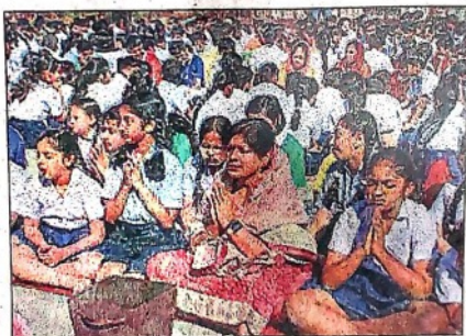
Gurukul students during the havan.