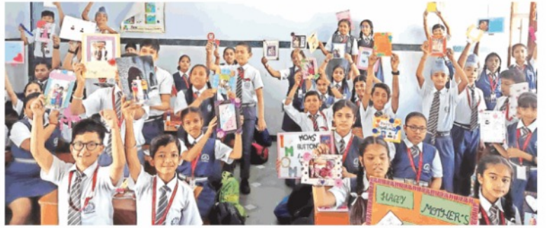
बच्चे मां के लिए कार्ड बनाते हुए।