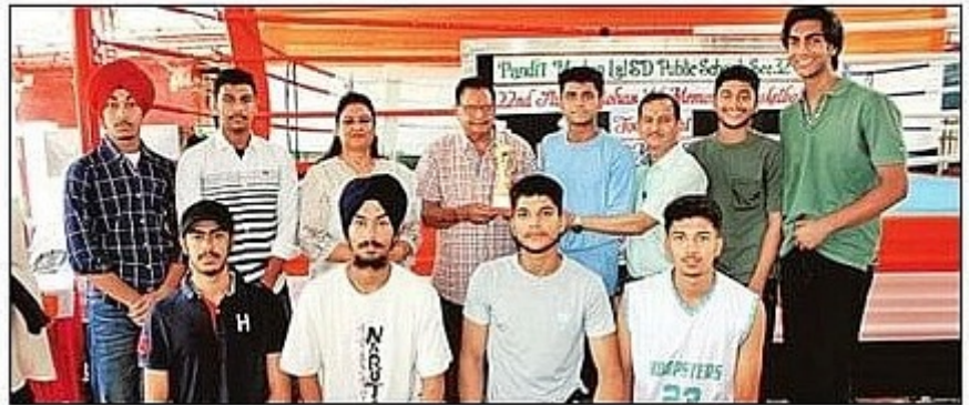
मुक्केबाजी प्रतियोगिता के विजेता एसडी स्कूल-32 के खिलाड़ी।

चंडीगढ़। 22वें पंडित मोहन लाल मेमोरियल बास्केटबॉल टूर्नामेंट और तीसरे पंडित मोहन लाल बॉक्सिंग टूर्नामेंट का आयोजन पीएमएल एसडी पब्लिक स्कूल-32 में किया गया। बास्केटबॉल चैंपियनशिप में लड़कों के वर्ग में गुरुकुल ग्लोबल स्कूल मनीमाजरा विजेता बना। वहीं गुरु नानक पब्लिक स्कूल सेक्टर-36 लड़कियों के वर्ग में विजेता रहा। बॉक्सिंग चैंपियनशिप में लड़के और लड़कियों के वर्ग में एसडी पब्लिक स्कूल-32 ओवरऑल चैंपियन बना। मुक्केबाजी और बास्केटबॉल के विजेताओं के बीच 2.5 लाख रुपये की इनामी राशि बांटी गई।