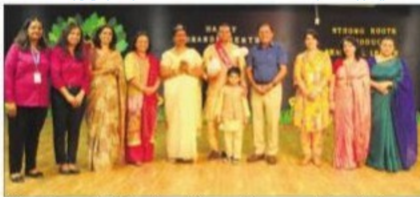
Grandparents' Day function underway at Gurukul Global School in Chandigarh.