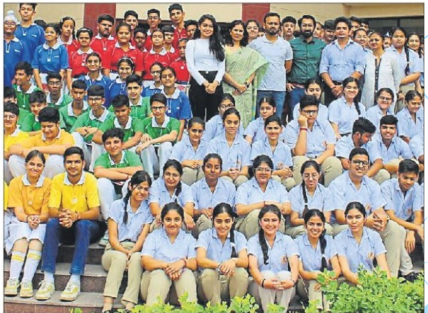
Students and alumni association members of Gurukul Global School during alumni meet.