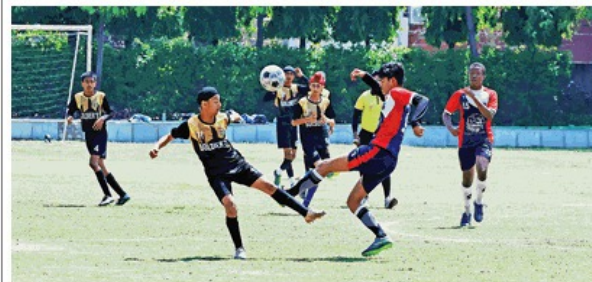
मैच खेलती सेंट जॉस और सेंट सोलजर इंटरनेशनल स्कूल की टीम