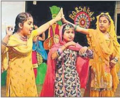
Gurukul students on Baisakhi.