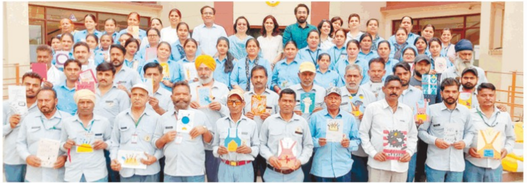
सैंक्टर-13 स्थित गुरुकुल ग्लोबल स्कूल में बच्चों द्वारा हैल्पर्स को दिए गए थैंक्यू कार्ड।