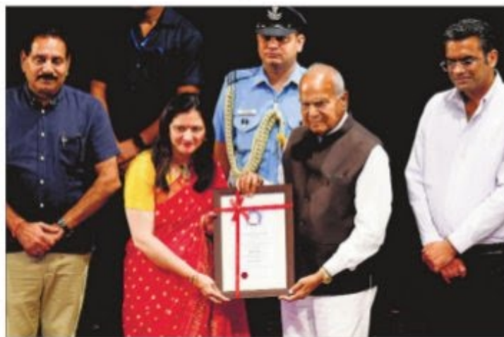
UT Administrator Banwarilal Purohit presents the state award to a teacher at Tagore Theatre.