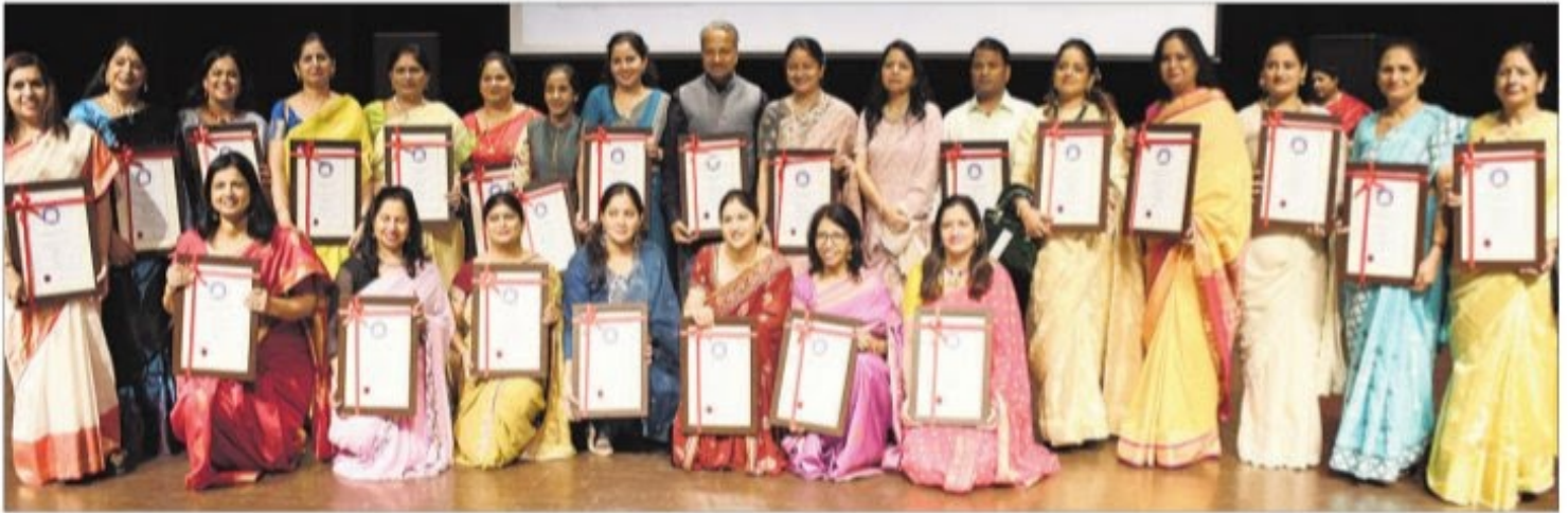
Teachers pose with their awards after the felicitation ceremony at Tagore Theatre, Chandigarh, on Tuesday.