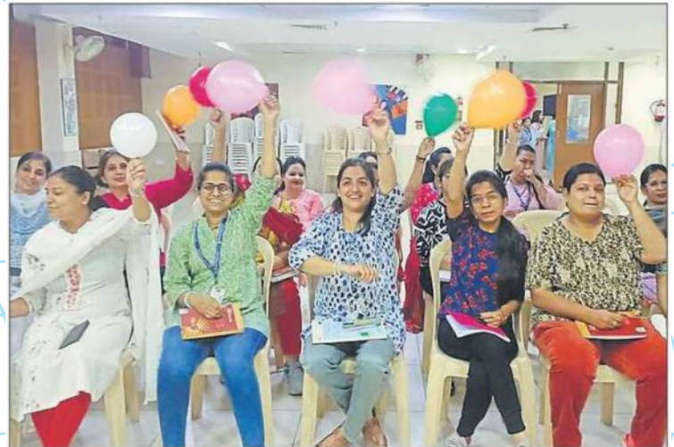
Attendees during the workshop in Gurukul Global School.